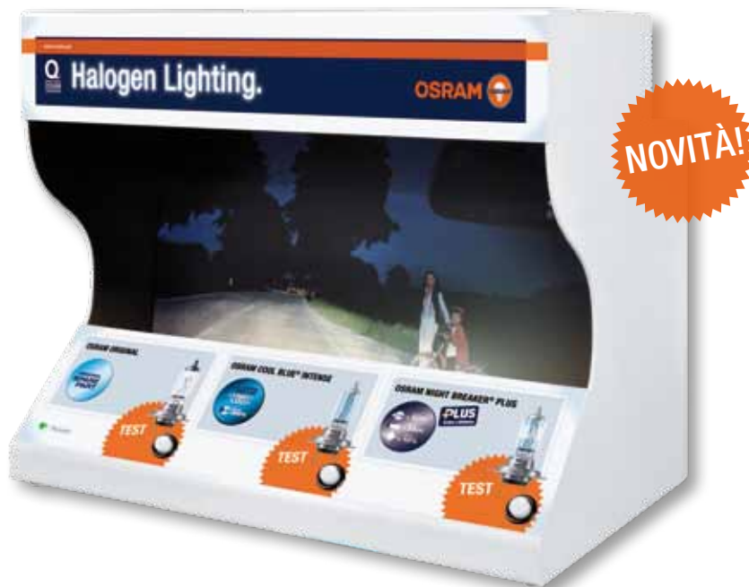
Formato (largh. x alt. x prof.): 40 x 33 x 25 cm

Sperimentare dal vivo la qualità è la migliore argomentazione per incrementare le vendite. Il Light Performance Box consente di testare l'incredibile differenza di intensità luminosa e colore tra OSRAM ORIGINAL e COOL BLUE® INTENSE o NIGHT BREAKER® PLUS.