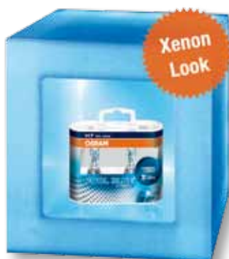
Demobox "LED Cube" Una „mini vetrina" illuminata da luce blu alternata a bianca. Enfatizza il prodotto e rende irresistibile la curiosità. Formato (largh. x alt. x prof): 20 x 20 x 15 cm