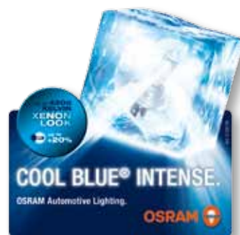
Wobbler Mette in moto le vendite. Grande richiamo grazie al formato 3D. Da applicare a banco o su espositore. Formato (largh. x alt.): 11 x 11 cm