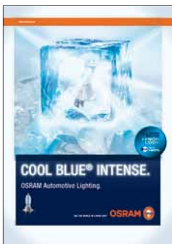
Poster A1 Decisamente accattivante, ovunque esposto richiama l'attenzione, anche da grandi distanze.

Con materiali per il punto vendita che catturano l'attenzione e convincono i clienti.