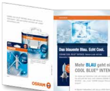
Customer Leaflet Piccola brochure COOL BLUE® INTENSE composta da quattro pagine con le principali caratteristiche, i vantaggi e un piccolo elenco dell'assortimento. Formato: A6