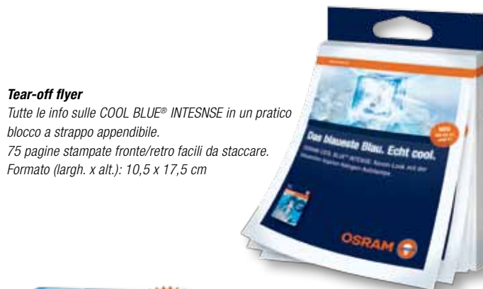
Tear-off flyer Tutte le info sulle COOL BLUE® INTENSE in un pratico blocco a strappo appendibile. 75 pagine stampate fronte/retro facili da staccare. Formato (largh. x alt.): 10,5 x 17,5 cm