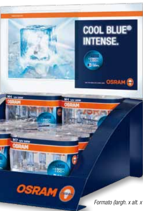
Formato (largh. x alt. x prof.): 30 x 34 x 31 cm

Di dimensioni compatte, accattivante e di qualità. L'espositore da banco OSRAM facilita la scelta veloce favorendo l'acquisto di impulso.