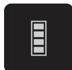
1 batteria da 9V inclusa

Migliore visibilità e quindi maggiore sicurezza per te e gli altri su strada