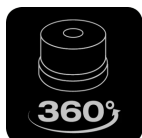
Luce di emergenza rotante a 360°

Migliore visibilità e quindi maggiore sicurezza per te e gli altri su strada